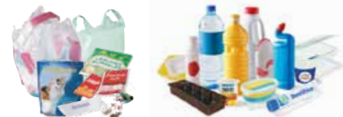
Plastiques souples Plastiques rigides

*Sac jaune à retirer gratuitement en mairie