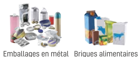
Emballages en métal Briques alimentaires