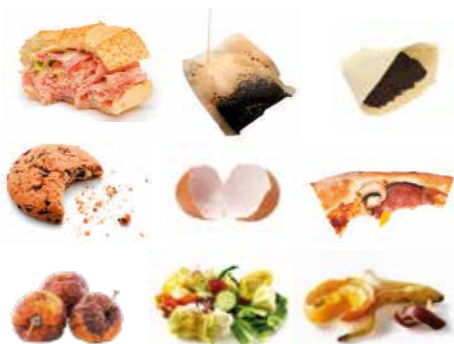
Déchets de cuisine

30% de biodéchets dans nos poubelles peuvent être valorisés en compost.