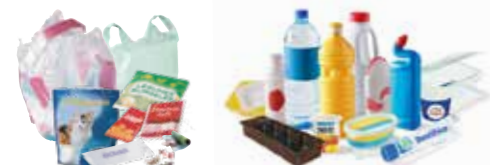
Plastiques souples Plastiques rigides

*Sac jaune à retirer gratuitement en mairie