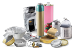
Emballages en métal