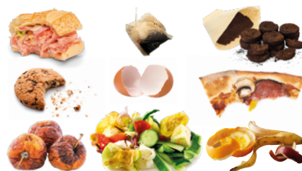
Déchets de cuisine